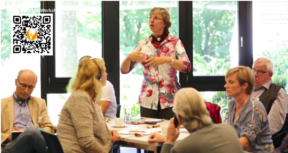
Durch die Workshops des PROMETHEUS-Projekts, sind Patienten aktiv an der Entwicklung neuer patientenorientierter Produkte beteiligt.

Informationsvideos für Patiente bieten einen schnellen und einfachen Zugang zu Expertenwissen Video Prostatakrebs-Rezidiv: youtu.be/TNuAHsN_VIA Video Impotenz: youtu.be/OktWkDf3tPo